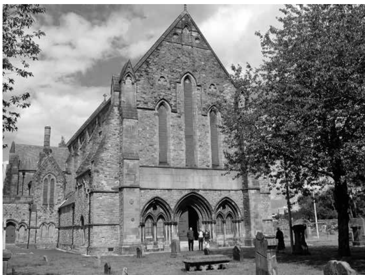
Het kerkgebouw van Govan

ren de Clyde en de Kelvin samen. De bevolking leefde er van de visserij en de landbouw. Op 8 januari 1650 werd hij daar op 22-jarige leeftijd bevestigd tot predikant.