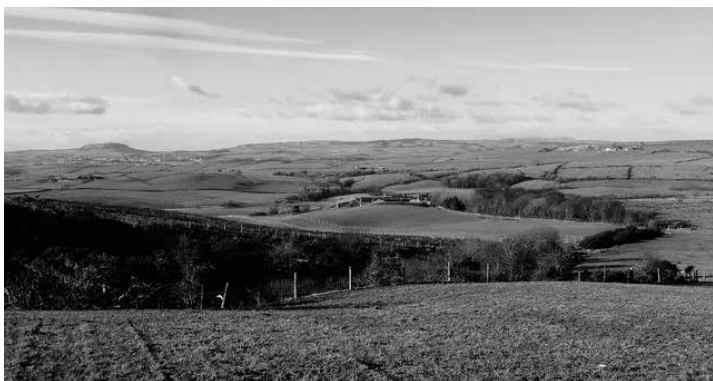
De omgeving van Dalvennan