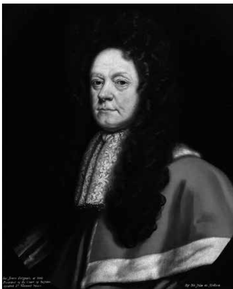
James Dalrymple (1619-1695)

plaats zou innemen, niet alleen om zijn grote geleerdheid, maar ook om zijn godsvrucht. Ze waren overtuigd van het grote belang dat een godvrezend persoon deze belangrijke positie zou innemen. Maar ook sommige hoogleraren van de universiteit drongen aan op zijn kandidatuur, ook vanwege zijn heldere geest en scherpzinnige oordeel. Naar gewoonte werden eerst alle universiteiten aangeschreven. Iedereen die voor dit ambt de capaciteiten had, kon zich melden en het zou zijn voor de geleerdste kandidaat. Die werd vastgesteld aan de hand van een te houden openbaar dispuut. Na een landelijke zoektocht naar een vervanger op de faculteit werden drie mannen geselecteerd om mee te dingen naar de functie. Een van de kandida-